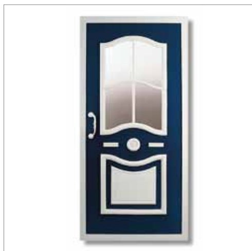
Různé typy vchodových dveří