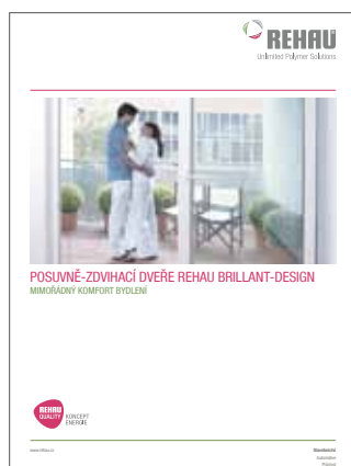
Prospekt posuvně-zdvihacích dveří Brillant-Design Tiskové číslo 785700CZ