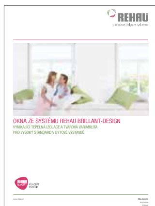
Prospekt okenních systémů Brillant-Design Tiskové číslo 799700CZ

Již více jak půl století firma REHAU ve světě vyvíjí a vyrábí profilové systémy pro okna, dveře a fasády, a to s inovativním myšlením propojeným s praxí a s tradičně vysokými požadavky na kvalitu. Proto využívají technici firmy REHAU také hodnotné poznatky z oblasti technického zařízení budov a inženýrských staveb, ve kterých je firma REHAU celosvětově rovněž mnoho let úspěšně činná. Tyto synergie, těsné partnerství s výrobci stavebních materiálů a průběžné proškolení pracovníků autorizovaných firem řadí skupinu REHAU k vedoucím výrobcům oken, dveří a fasád v České republice.